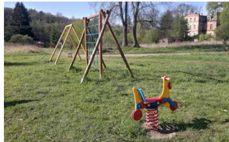
Borkowice – plac zabaw.

W minionym roku wykonano rozbudowę oświetlenia drogowego o sześć lamp. Oplacono zakup sprzętu do koszykarki. Ponadto dokonano prac naprawczych na placu zabaw dla dzieci, a także zakupiono impregnat do pomalowania urządzeń zabawowych. W ciągu roku dbano o jego bieżące utrzymanie. W trakcie akcji sprzątania miejscowości zakupiono potrzebne materiały. Dzięki wsparciu Urzędu Marszałkowskiego Województwa Dolnośląskiego zorganizowano wizyty studyjne i szkolenia dla mieszkańców województwa, w których brali udział również mieszkańcy Borkowic. Z Organizacji Pozarządowych dofinansowano poprzez stowarzyszenia ZHP – „Wakacje z Harcerską Lilijką” dla dzieci ze świetlic środowiskowych i wiejskich.