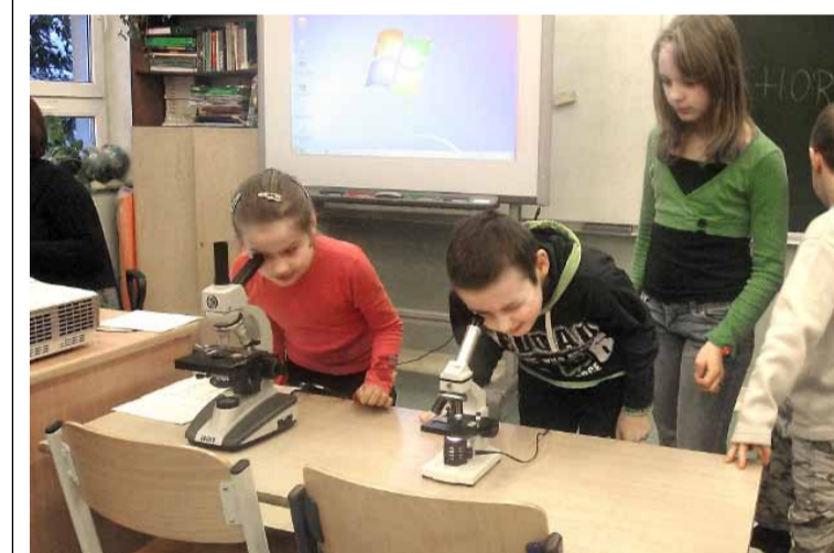
„Katar” – Jak działa system odporności?

Na zajęciach pod tytułem „Jak rozmawiać trzeba z psem” dzieci powtarzały i utrwały zasady zachowania się z zwierzętami domowymi i dzikimi. Co robić, aby ustrzec się pożaru, jak zachować się w razie jego wybuchu, jak czytać piktogramy – tego uczyły się dzieci na zajęciach zatytułowanych „Pali się”, „Pstryczek – elektryczek” to tytuł zajęć, w ramach których uczono zasad posługiwania się prostymi urządzeniami AGD. Zasady udzielania pomocy przedmedycznej uczniowie poznawali podczas zajęć zatytułowanych „Po rozum do głowy” i „Chory kotek”. Tu priorytetem była umiejętność wezwania pomocy, sprawdzenia przytomności, oddechu i ułożenia w pozycji bocznej ustalonej oraz opatrywania drob-