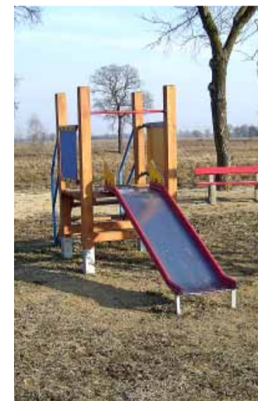
Raków – plac zabaw.

Wykonano dokumentację projektową i zakupiono materiały budowlane do lokalu przeznaczanego na cele społeczne. Zakupiono kosiarkę. Ponadto dokonano prac naprawczych na placu zabaw dla dzieci, a także zakupiono impregnat do pomalowania urządzeń zabawowych. W ciągu całego roku dbano o bieżące utrzymanie placu zabaw.