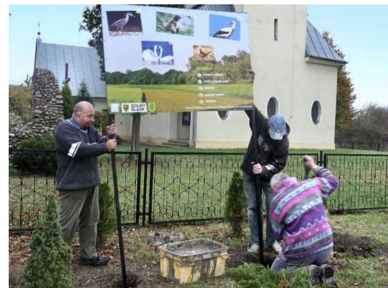
Kotowice – mieszkańcy montują tablicę informacyjną.

W ramach bieżącego utrzymania dróg dokonywano napraw dróg, a przy współpracy z PKP (w trakcie modernizacji linii kolejowej Wrocław-Poznań) zrealizowano dwa odcinki dróg gminnych. Wykonano projekt rozbudowy oświetlenia drogowego. Ponadto dokonano prac naprawczych na placu zabaw dla dzieci, a w ciągu całego roku dbano o jego bieżące utrzymanie. Podczas akcji sprzątania miejscowości zakupiono potrzebne materiały. Gmina Oborniki Śląskie była part-