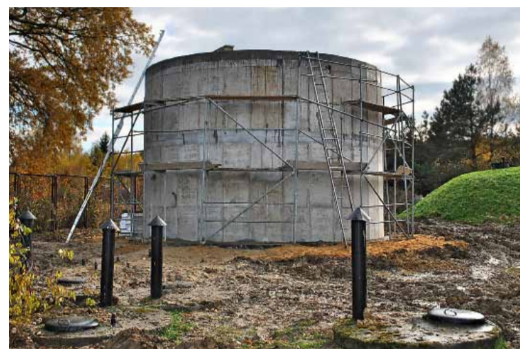
Pompownia w Osolinie – w trakcie budowy.

Gmina Oborniki Śląskie realizowała projekt z Programu Operacyjnego Kapitał Ludzki, w ramach którego prowadzone były zajęcia rozwojowe i edukacyjne dla mieszkańców pt. „Edukacja najlepszy start w przyszłość”. Wprowadzono projekt rozwojowy w czterech szkołach z Programu Operacyjnego Kapitał Ludzki oraz zapewniono finansowanie animatora sportowego na Orliku. W ciągu całego roku na skwerów i placu zabaw. W parku odnowiono rów oraz dokonano nasadzeń uzupełniających. We współpracy z Nadleśnictwem Oborniki Śląskie zorganizowana została akcja „Sprzątanie Świata” dla uczniów Szkoły Podstawowej. W trakcie akcji sprzątania miejscowości zakupiono potrzebne materiały. Z Organizacji Pozarządowych dofinansowano poprzez stowarzyszenia kilka imprez: