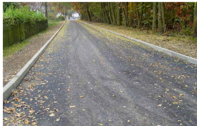
Wyremontowana droga w Osoli.

Wybudowano drogę o nawierzchni asfaltowej części ulicy Leśnej wraz z odwodnieniem. W ramach bieżącego utrzymania naprawiano drogi gruntowe. Zagospodarowano pod względem turystycznym skwer znajdujący się w miejscowości ze środków z LGD wspólnie ze Społecznym Stowarzyszeniem Wiejskim OKOLICE. Dokonano prac naprawczych na placu zabaw dla dzieci i w części parku, a w ciągu całego roku dbano o ich bieżące utrzymanie. Oplacono impregnat do pomalowania urządzeń zabawowych. Gmina Oborniki Śląskie była partnerem w projekcie „Przedsięwzięcia Promujące Ideę Odnowy Wsi”, w którym zakupiono tablice informacyjne oraz materiały promocyjne Osoli. Przeprowadzono prace pielęgnacyjne miejscowych drzew. Dzięki wsparciu Urzędu Marszałkowskiego Województwa Dolnośląskiego i LGD zorganizowano wizyty studyjne i szkolenia dla mieszkańców województwa, w których brali udział również mieszkańcy Osoli. W Osoli działa punkt przedszkolny dofinansowywany ze środków Budżetu Gminy Oborniki Śląskie prowadzony przez Stowarzyszenie OKOLICE. W ciągu całego roku z budżetu Gminy (dział profilaktyka) finansowano działalność świetlicy. Dofinansowano pacz-