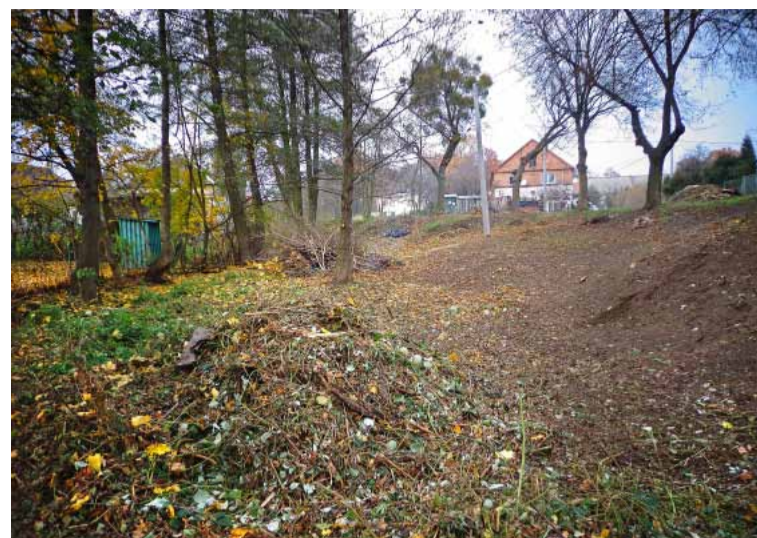
Morzęcin Wielki – teren po uporządkowaniu przez mieszkańców.