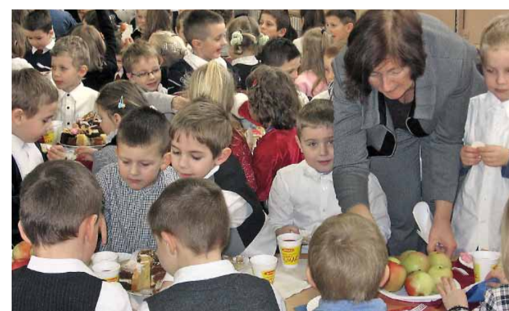
Wszyscy jesteście amatorami świątecznych smakowitości.

przyczynili się do zorganizowania szkolnej wigilii i poświęcili swój czas, aby przygotować poczęstunek, lepić pierogi, upiec ciasta, pomóc przy ustawianiu stołów i sprzątanii, w imieniu społeczności szkolnej serdecznie dziękujemy.