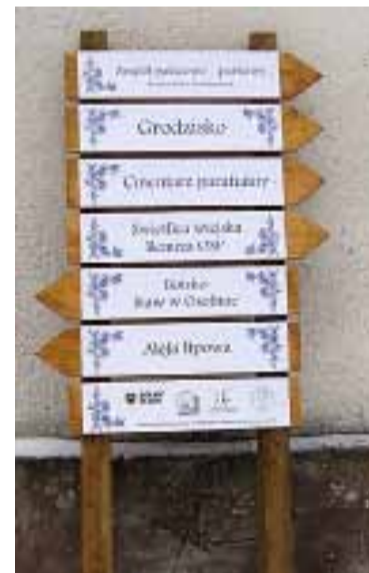
Bagno – wiatcz kierunkowy.

W miejscowości Nadleśnictwo Oborniki Śląskie ułożono nawierzchnię asfaltową na drodze Bagno-Mikorzycze. W ramach bieżącego utrzymania dróg dostarczono materiał kamienny oraz wykonano latanie ubytków w nawierzchni. Zakupiono tartacę oraz wykonano kosztorys robót remontowych i projekt przebudowy świetlicy wiejskiej. Ponadto dokonano prac naprawczych na placu zabaw dla dzieci, a także zakupio-