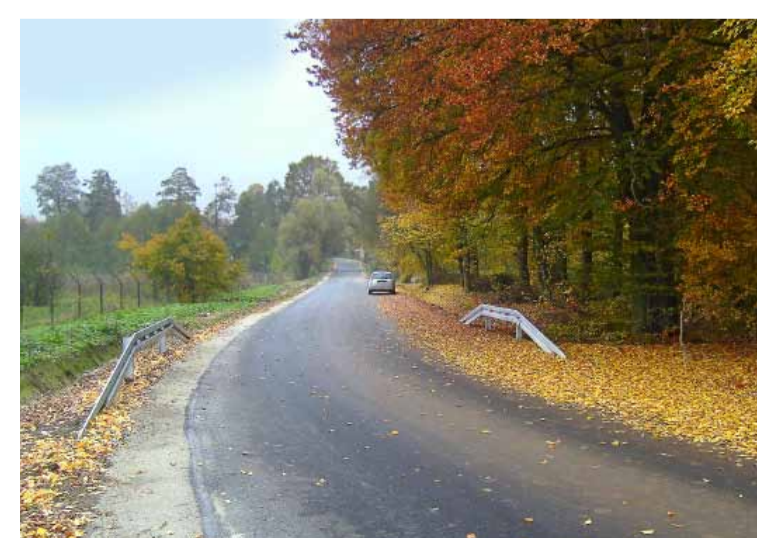
Wyremontowana droga w Kowalach.