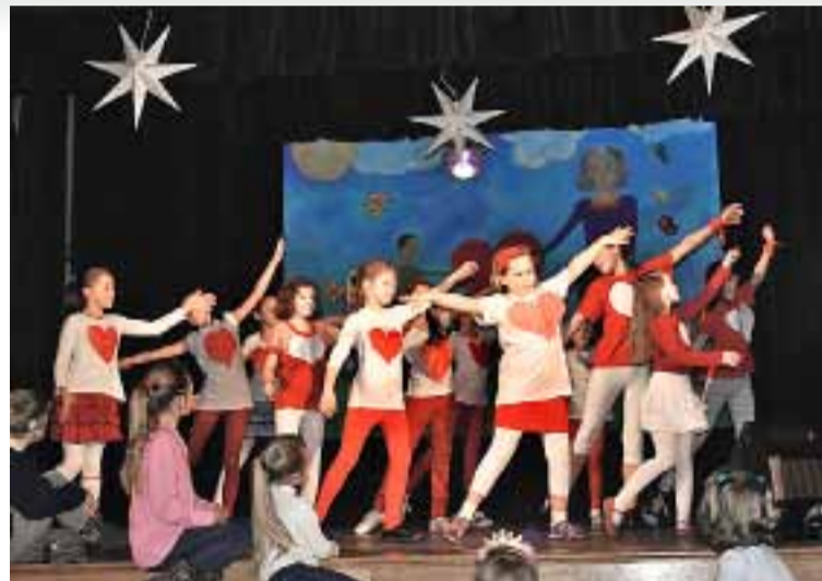
Dzieci z zespołu „Aplauz”

Od samego rana towarzyszyła wszystkim mieszkańcom niesamowita atmosfera. Nad wejściem do Sali widowiskowej OOK zawisło wielkie czerwone serce, a do środka „zapraszały” ubrane w serduszka choinki. Rozbrzmiewała też muzyka, która towarzyszyła nam przez cały dzień, a co jakiś czas odtwarzało hymn Wielkiej Orkiestry.