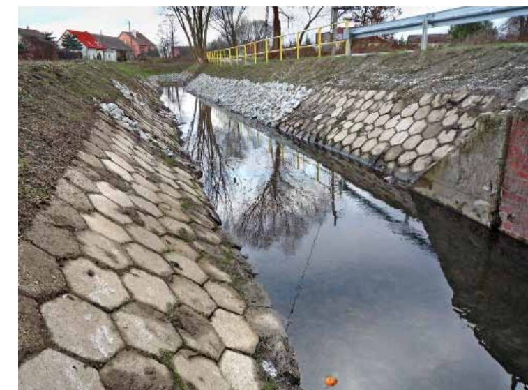
Oczyszczenie rzeki Młynówka w Lubnowie.