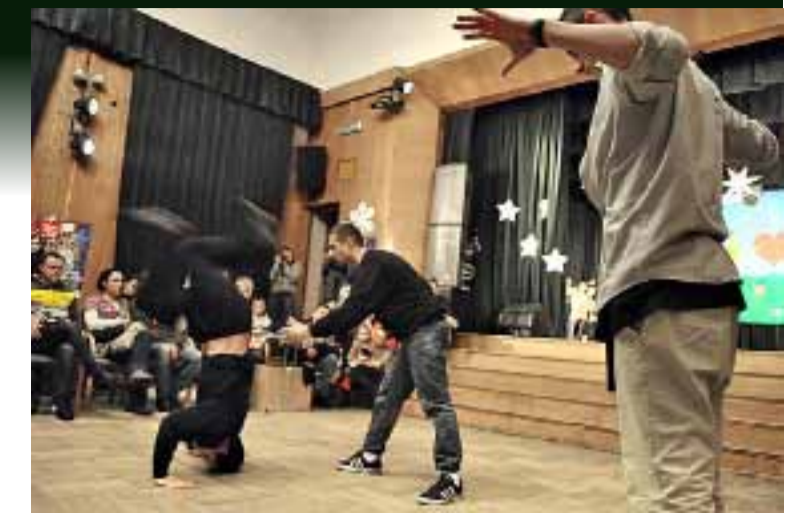
Występ Stowarzyszenie „Ekspresja”.

kowego zespołu „Trzynasta w Samo Południe” – półfinalistów programu „Must be the music”. Jak piszą o sobie na oficjalnej stronie: „Mio-