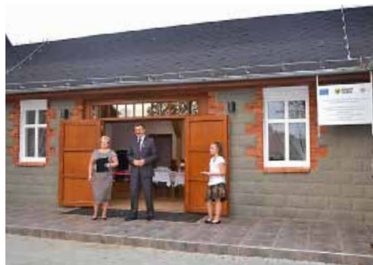
Otwarcie wyremontowanej świetlicy w Jarach.

W ramach bieżącego utrzymania dróg naprawiono ulicę: Sosnową, Lipową, Świerkową, Jodlową i Akacjową. Wyremontowano świetlicę wiejską, wyposażono ją w meble i sprzęty, a następnie przekształcono w Centrum Ekologiczno-Informacyjne w ramach Programu Rozwoju Obszarów Wiejskich. Za-