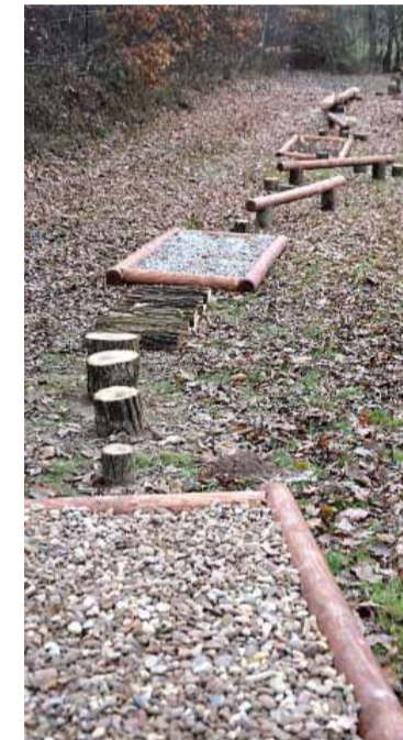
Kuraszków – ścieżka zmysłów.

Dzięki wsparciu Urzędu Marszałkowskiego Województwa Dolnośląskiego i LGD odbyły się wizyty studyjne i szkolenia dla mieszkańców województwa, w których brali udział również mieszkańcy Kuraszkowa. Zorganizowano warsztaty „Wyprawy Odkrywców” oraz opracowano dwie gry terenowe. W trakcie akcji sprzątania miejscowości zakupiono potrzebne mate-