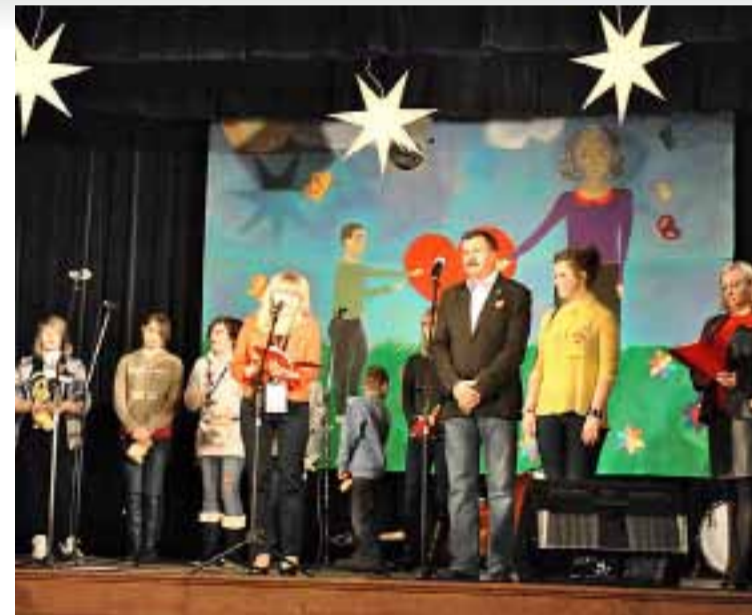
Przedstawienie organizatorów imprezy.