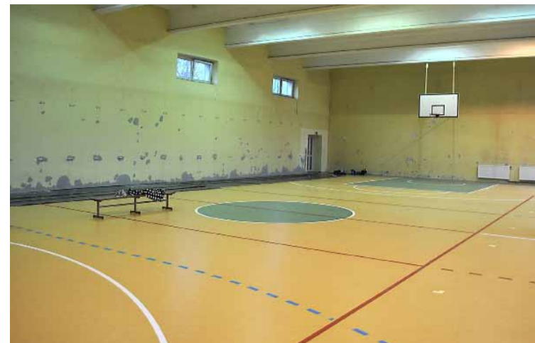
Sala gimnastyczna w Szkole Podstawowej w Pęgowie – w trakcie remontu.