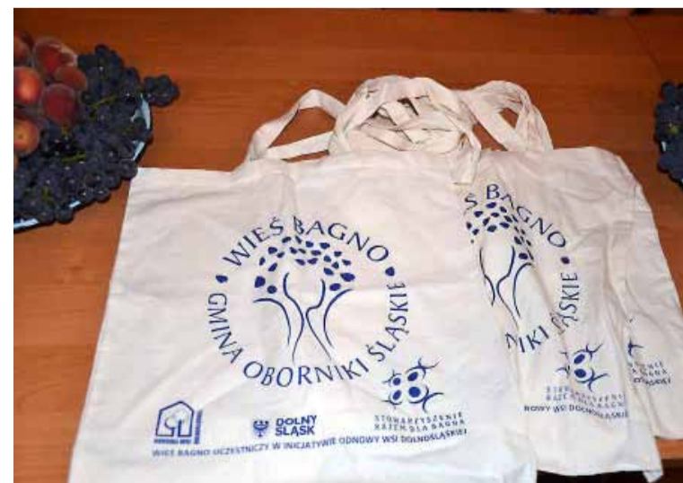
Bagno – materiały promocyjne.