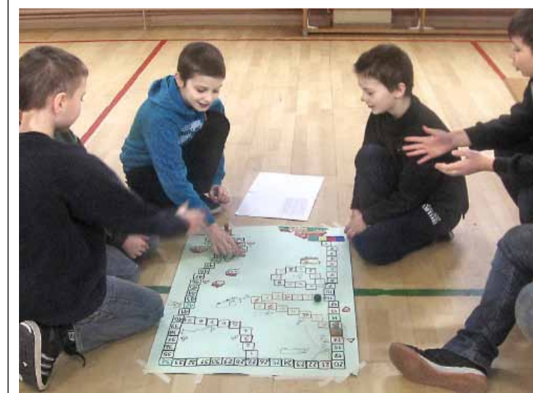
„Zielone światło” – krzyżówka: „Jestem bezpieczny”

nych ran i oparzeń. Profilaktykę chorób zakaźnych omawiano na zajęciach pod tytułem „Katar” Intrygujący tytuł „Cuda i dziwy” nadano zajęciom związanym ze szkodliwym wpływem na zdrowie i życie różnorodnych używek. „Paweł i Gaweł” to bohaterowie zajęć traktujących o żywiołach i uczących zachowania w razie powodzi, burzy i huraganu. Przypomnienie zasad ruchu drogowego oraz bezpieczeństwo w zabawach podczas ferii zimowych były przedmiotem zajęć zatytułowanych „Zielone światło”. O swoich obawach i lękach mali studenci mogli porozmawiać i wyrazić w formie rysunkowej w ramach zajęć pt. „Bajka terapeutyczna”.