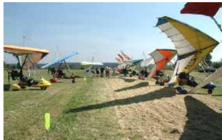
Gołędzinów – Piknik Lotniczy.