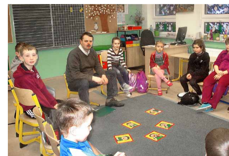
„Bajka terapeutyczna” – galeria lęków.

Na zajęciach pod tytułem „Jak rozmawiać trzeba z psem” dzieci powtarzały i utrwały zasady zachowania się z zwierzętami domowymi i dzikimi. Co robić, aby ustrzec się pożaru, jak zachować się w razie jego wybuchu, jak czytać piktogramy – tego uczyły się dzieci na zajęciach zatytułowanych „Pali się”, „Pstryczek – elektryczek” to tytuł zajęć, w ramach których uczono zasad posługiwania się prostymi urządzeniami AGD. Zasady udzielania pomocy przedmedycznej uczniowie poznawali podczas zajęć zatytułowanych „Po rozum do głowy” i „Chory kotek”. Tu priorytetem była umiejętność wezwania pomocy, sprawdzenia przytomności, oddechu i ułożenia w pozycji bocznej ustalonej oraz opatrywania drob-