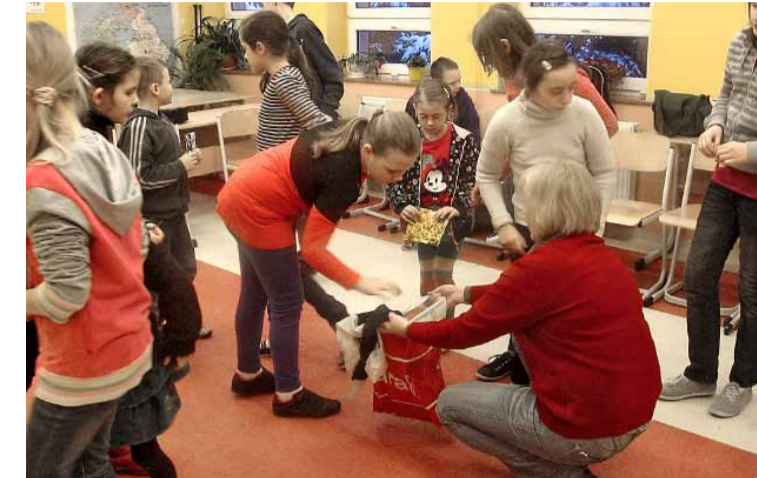
„Cuda i dziwy” – zgubne nalogi.

Mali studenci wyposażeni w indeksy zostali podzieleni na różnicowane wiekowo grupy i w dniach 22–23 stycznia 2013 roku poprzez zabawę uczyli się żyć bezpiecznie.