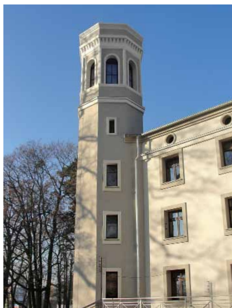
Odrestaurowany pałac rodziny von Schaubertów w Obornikach Śląskich.

W ramach bieżącego utrzymania naprawiano drogi gruntowe. Wyremontowano chodnik przy drodze wojewódzkiej – ulica Główna na długości 670 mb (w tym remont przepustów, wjazdów i renowacja rowów). W ramach dotacji z Gminy Oborniki Śląskie wykonano rekonstrukcję dwóch tarcz zegarowych oraz sporządzono dodatkową dokumentację budowlaną – konserwatorską zabytkowego kościoła. Zakupiono wóz strażacki na potrzeby Ochotniczej Straży Pożarnej. Gmina Oborniki Śląskie była partnerem w projekcie „Przedsięwzięcia Promujące Ideę Odnowy Wsi”, w którym zakupiono tablice informacyjne, witacze oraz przeprowadzono szkolenia dla mieszkańców. W miejscowości działają punkt przedszkolny finansowany ze środków Budżetu Gminy Oborniki Śląskie. Sfinansowano materiały do wykonania ogrodzenia boiska sportowego. Ponadto dokonano prac naprawczych na placu zabaw dla dzieci, a także zakupiono impregnat do pomalowania urządzeń zabawowych. W ciągu całego roku dbano o bieżące utrzymanie placu zabaw. Zakupiono materiały potrzebne w czasie akcji sprzątania miejscowości. Dzięki wsparciu Urzędu Marszałkowskiego Województwa Dolnośląskiego i LGD zorganizowano wizyty studyjne i szkolenia dla mieszkańców województwa, w których brali udział również mieszkańcy Rościławic. Przeprowadzono szkolenia dla mieszkańców z moderatorami „Odnowy Wsi”, podczas