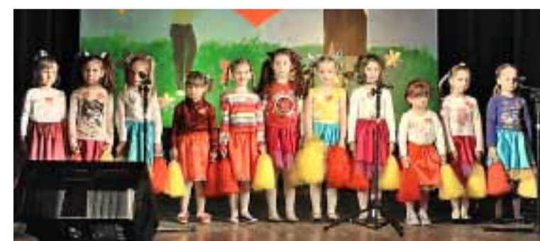
Dzieci z Przedszkola Publicznego w Obornikach Śląskich