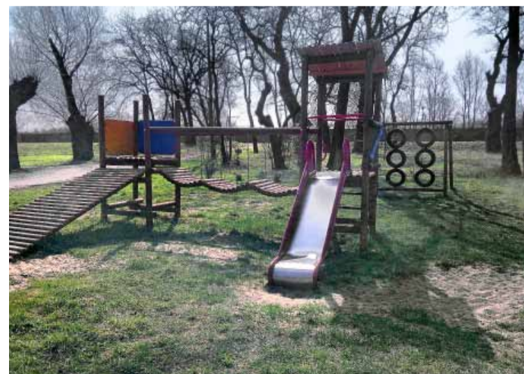
Paniowice – plac zabaw.