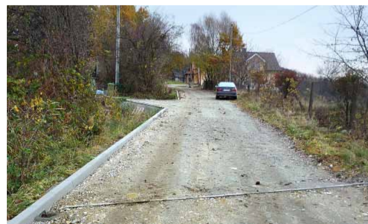
Piekary – wykonanie drogi i przepustów na drodze gminnej.

Szkoły Podstawowej i Gimnazjum. Zorganizowano warsztaty „Wyprawy Odkrywców”. Gmina Oborniki Śląskie zgłosiła wieś Pęgów do konkursu „Piękna Wieś Dolnośląska”, w ramach której została przyznana nagroda przez Urząd Marszałkowski za zajęcie I miejsca w wysokości 6000 zł. W Szkole Podstawowej utworzono oddział klasy „zero”. Dzięki wsparciu Urzędu Marszałkowskiego Województwa Dolnoślą-