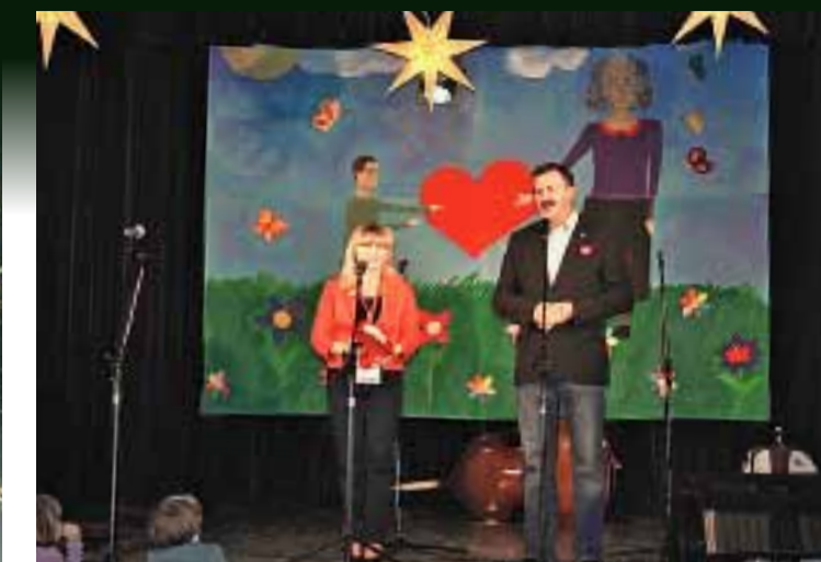
Otwarcie imprezy przez Burmistrza Obornik Śląskich.

Punktualnie o godz. 20.00 mieszkańcy mogli podziwiać pokaz sztucznych ogni pt. „Światło do nieba”. Wystrzały było słychać nie tylko w Obornikach Śląskich,