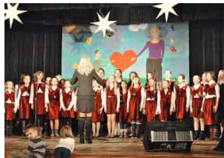
Chór ze Szkoły Podstawowej Nr 3 w Obornikach Śląskich