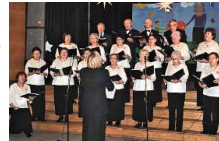
Występ chóru Uniwersytetu Trzeciego Wieku „Atena”.